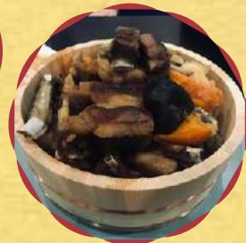
ホルホグ (石焼骨付き羊肉)