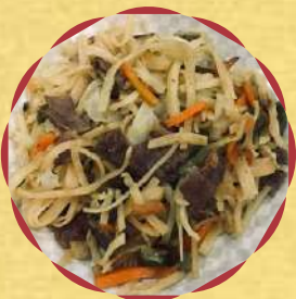
ツオイワン (焼きうどん)