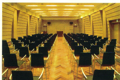
10F: 佐治敬三メモリアルホール (最大192名/シアター型式)