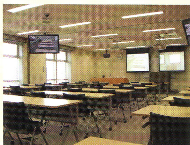
5F: 講義室 507 (最大72席/机24)