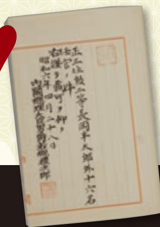
長岡半太郎が 初代大阪帝国大学総長に 任命された際の「任職裁可書」 昭和6年(1931)

教科書で学んだ歴史資料から、 “これも公文書!?”という意外なものまで… 国立公文書館が所蔵する個性豊かな公文書とともに、 大阪および大阪大学関係資料をご紹介します。