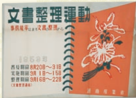
通商産業省が実施した「文書整理運動」ポスター 昭和28年(1953)

大阪大学アーカイブズは、大阪大学の法人文書のうち歴史的価値を有する文書及び大阪大学の歴史に関する資料を適切に管理するために、平成24年10月1日に設置された組織です。大阪大学総合学術博物館は、平成14年に全国で第8番目の国立大学総合博物館(省令施設)として発足しました。大阪大学の歴史から最新の教育・研究成果までを学内外に紹介する様々な活動を行っています。