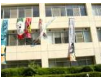
会場は箕面キャンパス A 棟 416号講義室でした。→