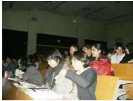
当日はもちろん専攻語の同窓会